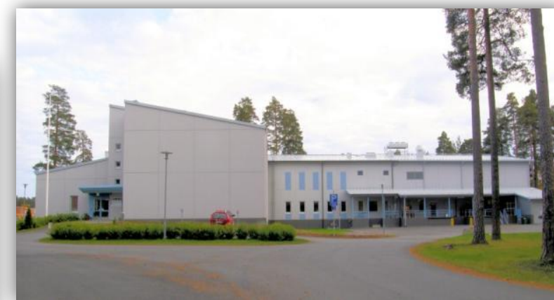
Tilat vuonna 2009, pääovelle vievä polku on nyt päällystetty. Alkuperäiset tilat ovat jääneet kasvun jalkoi kadonneet näkivistä mutta eivät unohtuneet.

Aloittanut toimintansa vuonna 1981 Säilyttää ja asettaa tutkijoiden käyttöön yritysten ja elinkeinoelämän järjestöjen pysyvästi säilytettävää asiakirjoja 24 hyllykilometriä asiakirjoja Työllistää noin 40 henkilöä Kansallisarkiston jälkeen Suomen toiseksi suurin arkisto