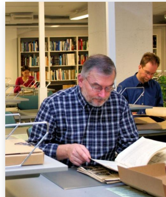
Kunnostettu aineisto on herättänyt suurta kiinnostusta Kansallisarkiston Sörnäisten toimipisteen tutkijalain keskuudessa.

Digitointiprojektit työllistävät tällä hetkellä 4 henkilöä Elkassa Omana työnä digitoidaan mikrofilmejä, valokuvia ja asiakirjoja Videot ja äänitteet digitoidaan ostopalveluna Projektien tuloksena syntyy dataa noin 15 000 Gt (15 teratavua)