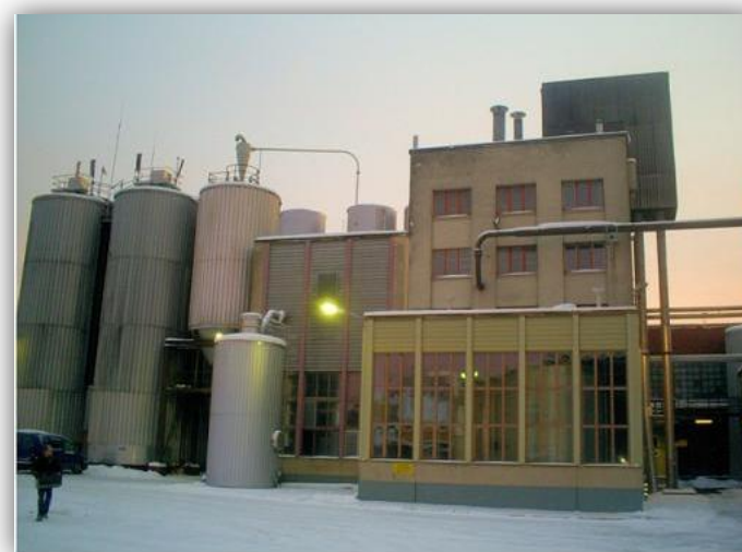
Porin Oluttehtaan jo hiljentyneitä tuotantolaitoksia arkistojen noutamisen aikaan.

Arkiston noutaminen tapahtui ns. avaimet käteen -periaatteella, jossa Elka huolehti kaikista käytännön järjestelyistä. Mikkelistä lähti kaksi tarmokasta työntekijää Poriin valikoimaan pysyvään säilytykseen otettavaa aineistoa. Samalla he myös pakkasivat aineiston rullakoihin, ja Itella huolehti aineiston kuljetuksen arkistoon Mikkelisiin. (OA)