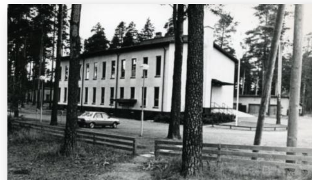
Arkiston tilat vuonna 1981 toiminnan alkaessa.

Merkittävin lähijajan haaste on sähköisen asi aineiston vastaanottamisen suunnittelu. asiakirjojen digitoiminen ja tiedon jakam digitaalisesti tietoverkkojen kautta tulee lisään tulevaisuudessa (OA)