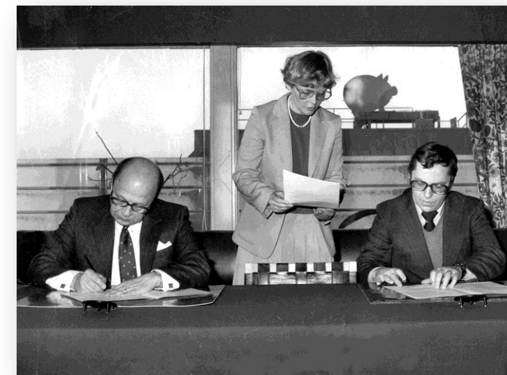
Elinkeinoelämän Keskusarkiston Säätiön säädekirjan allekirjoitustilaisuus 1979