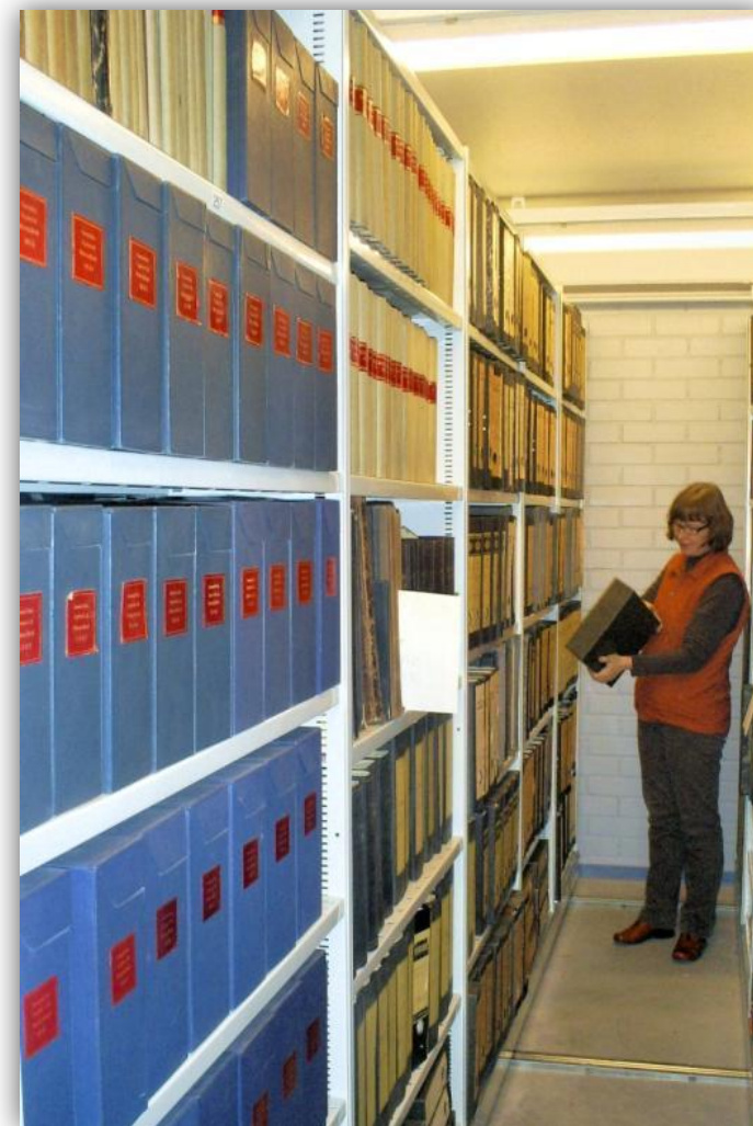
Kirjapainon materiaaliin alustavasti tutustumassa Kirjapainon arkiston hyllytystä. Kuvassa on Kirjapainon arkiston hyllytystä. Kuvassa on Kirjapainon arkiston hyllytystä.